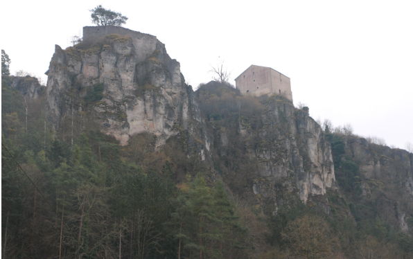
Bild 3: Blick vom Altmühltal auf die imposanten Kalkfelsen mit teilen vom Schloss.