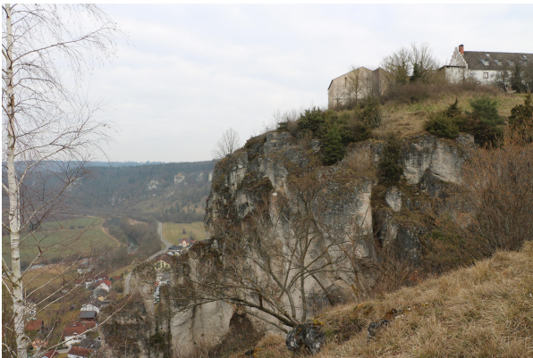
Bild 1: Imposante Felshänge bilden den Schlossberg mit dem Hotel auf dem Plateau