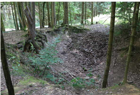
Bild 3: Wurzelfreistellung, durch anhaltendes Absinken des Bodens