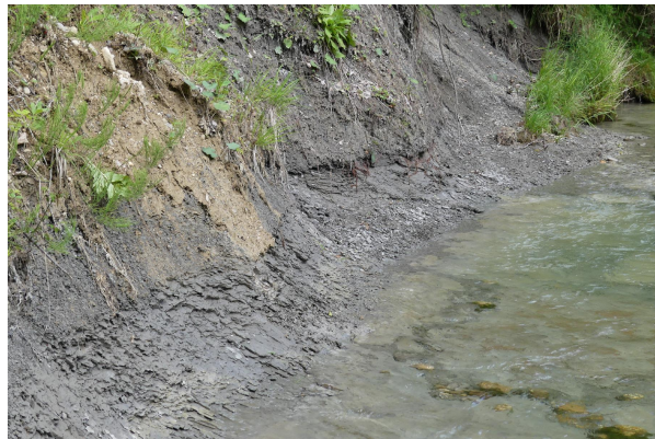
Bild 2: Tonmergel-Schichten am Prallhang und im Flussbett der Leitzach