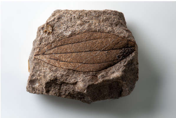
Bild 1: Versteinerter Zimtblattabdruck aus dem Kaltenbachgraben (Otto-Hölzl-Sammlung des LfU)