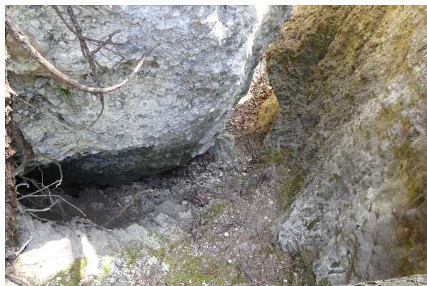
Bild 4: Trennfuge - unten frische Öffnung neben älterem bemoosten Grund, rechte Wand versintert