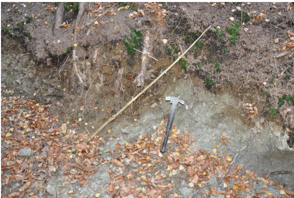
Bild 1: Der Stock markiert den Verlauf der F.L.. Links davon Epigneise über Störungsletten, rechts Benkersandstein