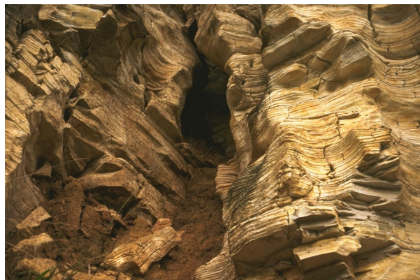
Bild 4: Deteil der typischen Bankung der Plattenkalke im Kalkschieferbruch Zandt