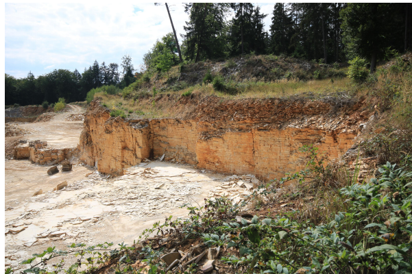
Bild 2: Blick auf die Plattenkalke der Schamhauptener Wanne mit typischer Bankung