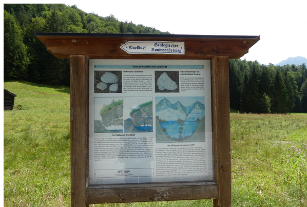
Bild 4: Erläuterungstafel zu Quelltopf und Gletscherschliff südlich vom Parkplatz