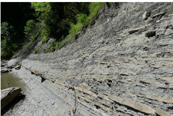
Bild 3: Sandsteinbänke zwischen Mergelsteinen der Baustein-Schichten