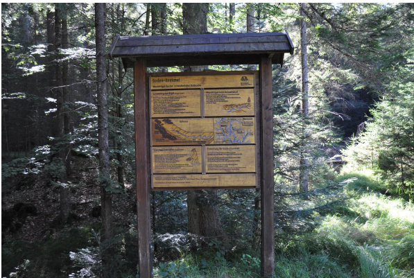
Bild 1: Info-Tafel der Nationalparkverwaltung zu den nur wenige Meter neben dem Wander-/fahrweg liegenden Seifenhügeln.