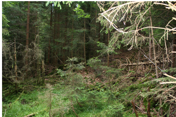
Bild 2: Der größte Teil des Areals ist im dichten Gehölz des Waldes versteckt und nicht zugänglich/sichtbar.