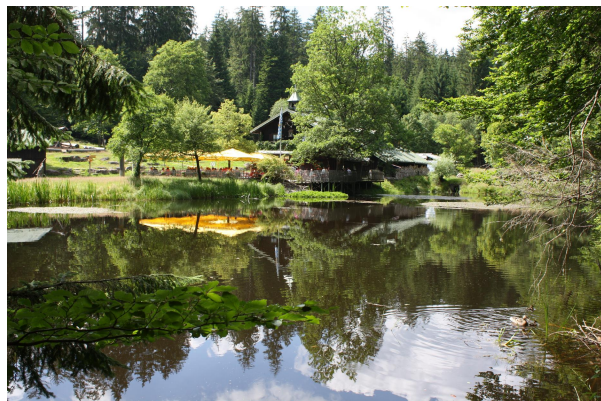
Bild 4: Nur etwa 250 m nordnordwestlich der Seifenhügel lädt das Schwellhäusl zum Verweilen ein.