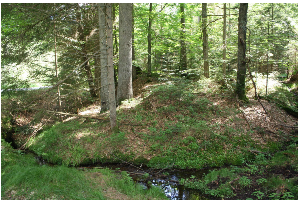
Bild 3: Seifenhügel im lichten Wald unmittelbar am Fahr-/Wanderweg vom Schwellhäusl zum Deffernik-Parkplatz