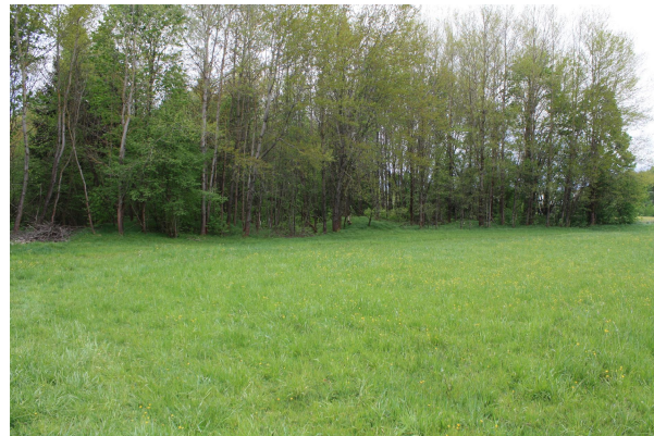
Bild 2: Seifenhügel im Waldstück beim Industriegebiet Fürhaupten Nord