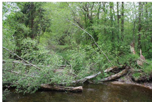
Bild 4: Die Seifenhügel ziehen sich bis ans Ufer des Regenseitenarms.