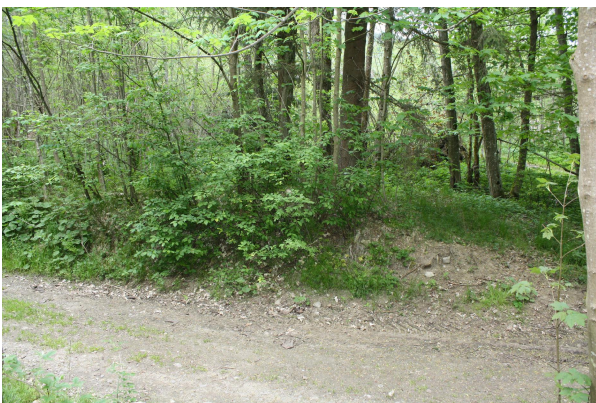
Bild 3: Entlang des Fahrwegs zur Furt über den Regenseitenarm sind die Seifenhügel durch die Wegebauarbeiten z.T. angerissen.