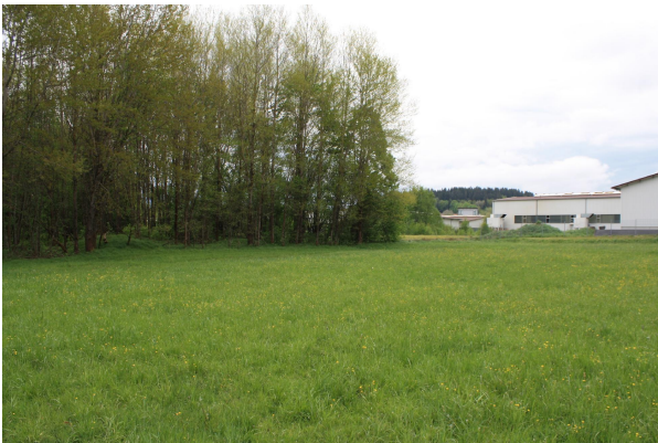
Bild 1: Unruhiges Relief der Seifenhügel in dem östlich des Industriegebiets gelegenen Wäldchen.