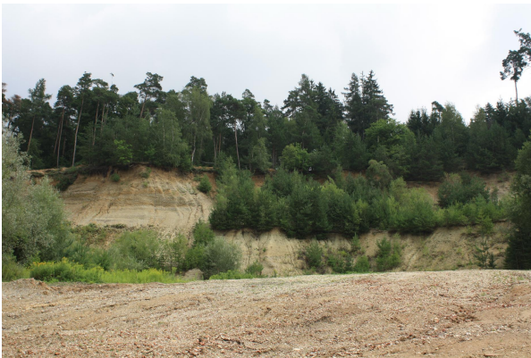
Bild 1: Der zentrale Teil der ehemaligen Kiesgrube scheint mit Bauaushub verfüllt zu sein (Molasse-Material und Ziegel usw.).