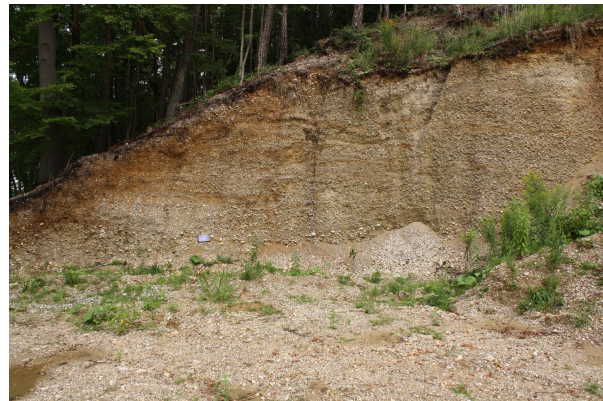
Bild 2: Im Nordeck der ehemaligen Grube wird wohl noch sporadisch Kies abgegraben (2014).