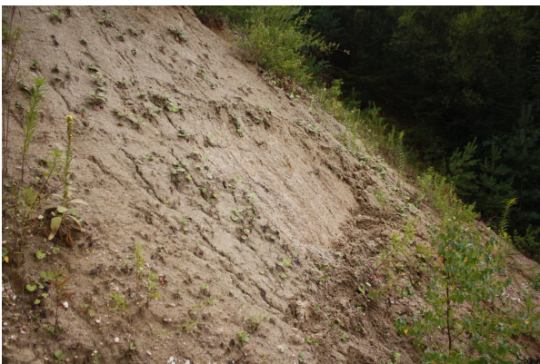
Bild 3: Der früher deutlich zu sehende Mergelhorizont ist inzwischen überdeckt.