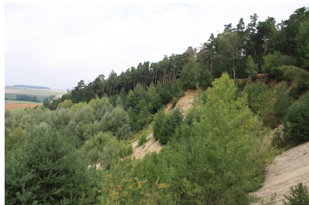
Bild 4: Blick vom Südeck der ehemaligen Kiesgrube entlang der schon stark verfallenen Abbauwand