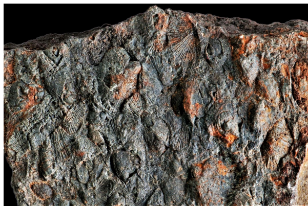
Bild 4: Brachiopoden im Unteren Erzhorizont der Griffelschiefer-Formation (Sammlung LfU)