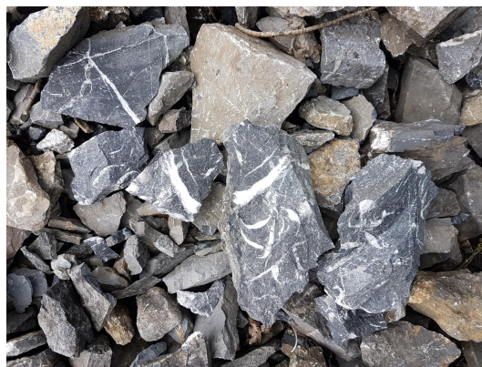
Bild 4: Typischer dunkelgrauer Kohlenkalk mit weißen Calcitadern