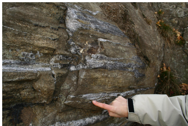
Bild 4: Bräunlicher Paragneis mit hellen Quarzlinsen