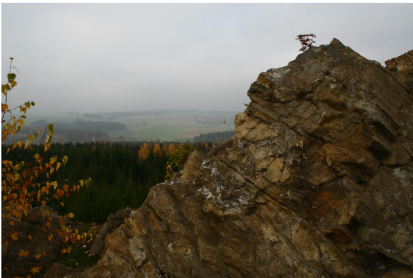
Bild 1: Blick vom Gneisfelsen Uprode über die Münchberger Hochfläche