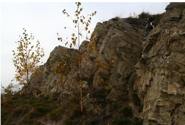
Bild 3: Schieferung und steile Klüftung am Gneisfelsen