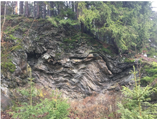
Bild 1: Faltenbildung in Tonschiefer-Grauwacke-Wechselagerung.