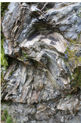
Bild 3: Stark gefaltete Wechselagerung Tonschiefer-Grauwacke des Unteren Karbon (Detail).