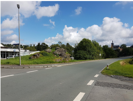
Bild 1: Der Felsen liegt direkt neben der Straße