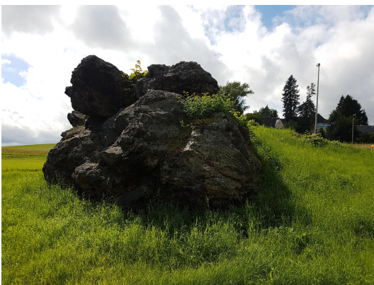
Bild 3: Der Felsen erhebt sich aus einer Wiese