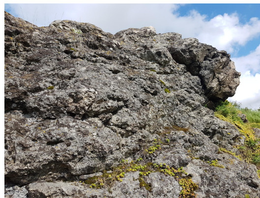
Bild 4: Detailansicht des zerrütteten Gesteins