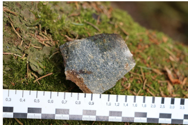
Bild 2: Detailbild eines Handstückes vom grauen Hirschberger Gneis.