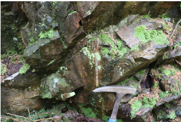
Bild 1: Angewitterter Hirschberger Gneis nördlich von Untertiefengrün.