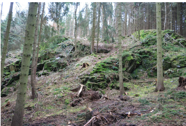
Bild 3: Aufschlussverhältnisse des Hirschberger Gneises, der sich in einem kleinen Waldstück westlich der Saale befindet.