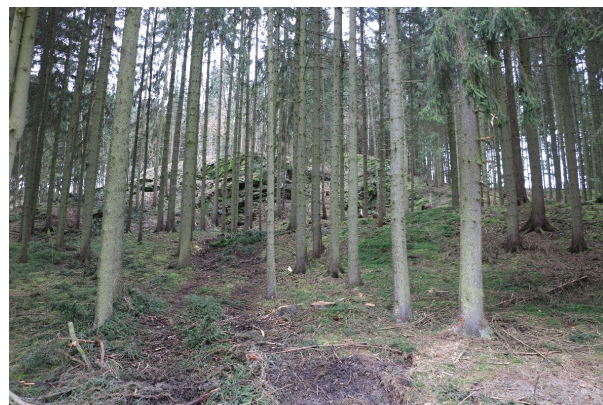
Bild 4: Blick nach Westen vom Weg an der Saale auf den Aufschluss.