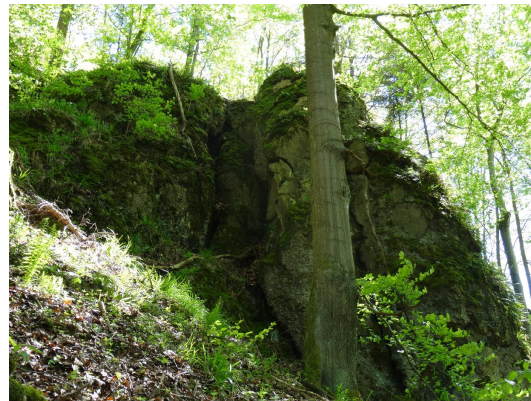
Bild 2: Fels aus Diabastuffbrekzie am Wanderweg "Geopfad Geroldsgrün"