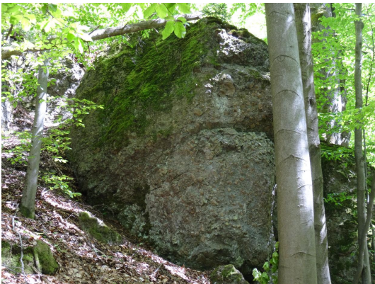
Bild 1: Fels aus Diabastuffbrekzie am Wanderweg "Geopfad Geroldsgrün"