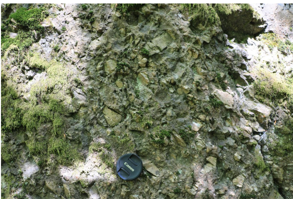
Bild 3: Oberdevonische Diabastuffbrekzie mit Dezimeter großen Brekzien