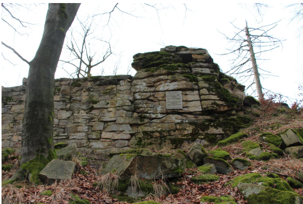
Bild 1: Links Mauerreste der Ruine Hirschstein, rechts natürliche Felsfreistellung