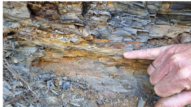
Bild 2: Grenze Ordoviz-Silur: Unterhalb der ockerfarbenen Grenzfläche Lederschiefer, darüber Graptolithenschiefer