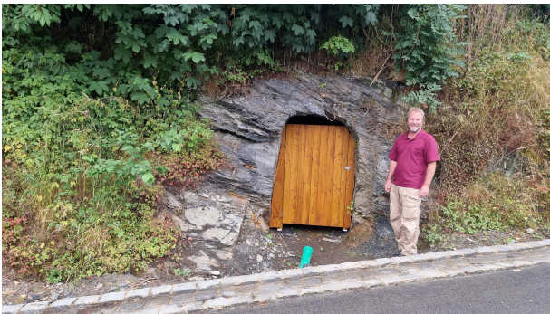
Bild 1: Aufschluss der Grenze Ordoviz-Silur an der Ottendorfer Straße