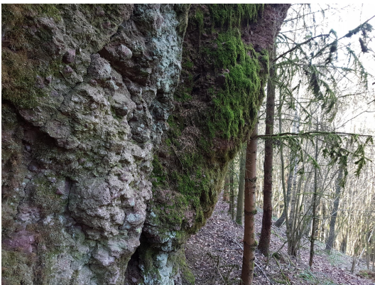
Bild 3: Detailaufnahme mit erkennbaren Pyroklasten