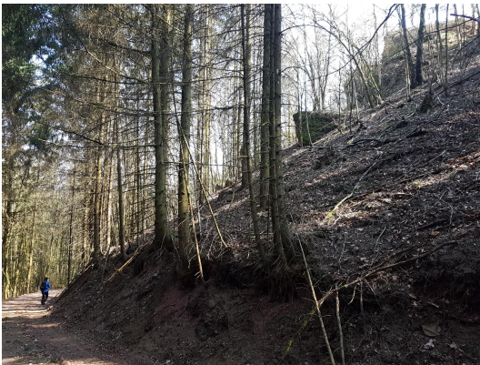
Bild 1: Blick vom Forstweg nach oben zum NW-Ende der Felsrippe