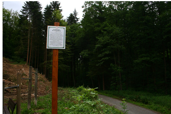
Bild 2: Infotafel des Geologischen Lehrpfads im Schorgasttal