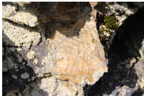
Bild 4: Heller Keratophyrtuff mit typischer Zerklüftung