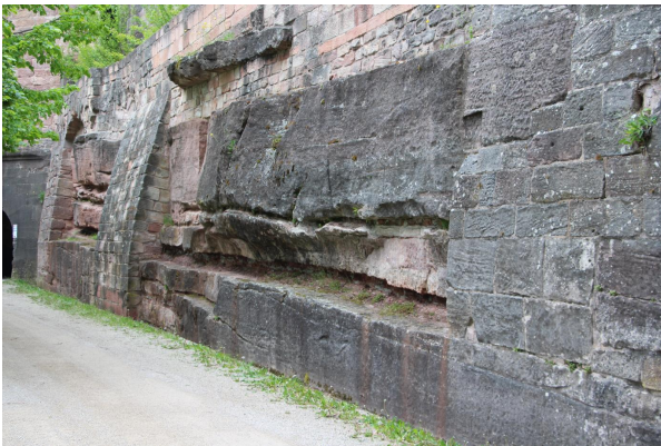
Bild 1: Der Aufschluss befindet sich beim Durchgang in den Kasernenhof.