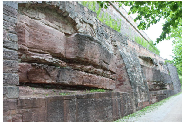
Bild 2: Im unteren Teil wurde der anstehende Fels bearbeitet, um eine glatte Mauerfront zu erhalten.