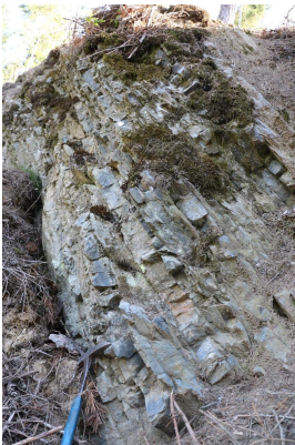
Bild 1: Abfolge von Ton- und Kieselschiefern in bis zu 10 cm mächtigen Lagen