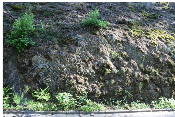
Bild 4: freigestellte Abfolge aus Ton- und Kieselschiefern, tw. zerrüttet