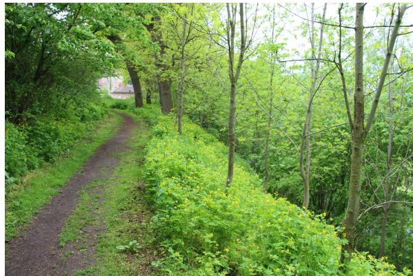
Bild 2: Der Frankenweg auf der Terrassenkante, im Hintergrund Schloss Steinenhausen