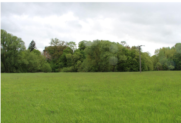
Bild 3: Blick von Norden auf die Terrassenkante mit Schloss Steinenhausen