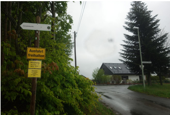
Bild 1: Wegweiser von der Hohenreuther Siedlung zum Aussichtsfelsen