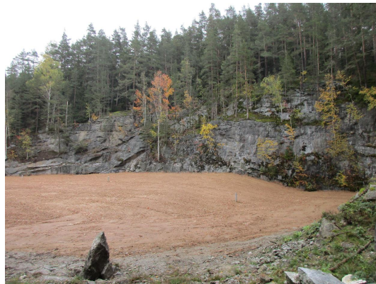
Bild 2: Verfüllte und planierte Steinbruchsohle