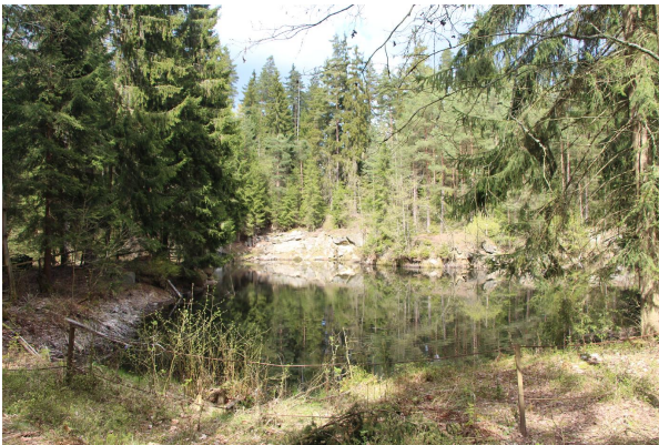
Bild 1: Blick in den wassergefüllten Steinbruch