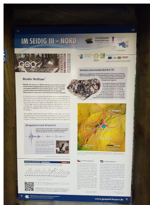
Bild 4: Infotafel des Geo-Erlebniswegs Weißenstadt