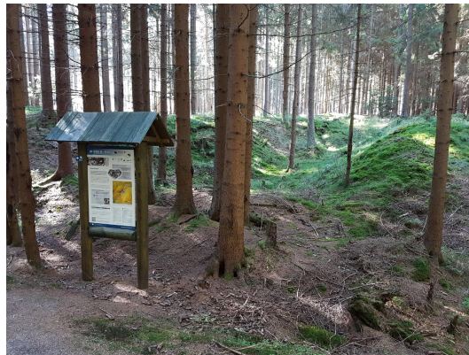
Bild 2: Infotafel am Geo-Erlebnisweg Weißenstadt