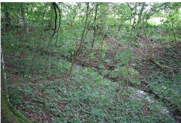
Bild 3: Ponordoline mit temporärem Wasserzufluss (Blickrichtung nach Westen)