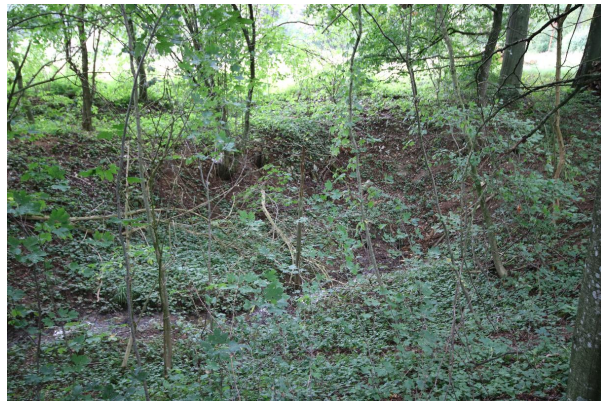
Bild 2: Ponordoline mit temporärem Wasserzufluss (Blickrichtung nach Nord-Westen)