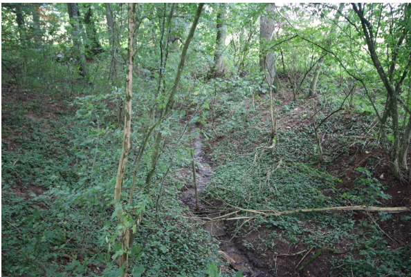
Bild 1: Ponordoline mit temporärem Wasserzufluss (Blickrichtung nach Süd-Westen)