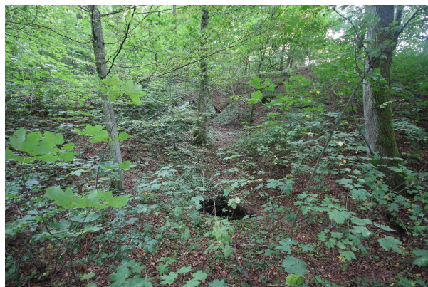
Bild 4: Ponordoline mit steilem Loch durch Nachsackung (Blickrichtung nach Süd-Osten)