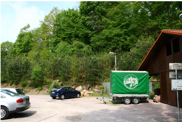
Bild 1: Der Aufschluss ist kaum noch zu erkennen