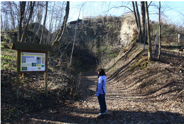
Bild 1: Infotafel der Georoute des Naturparks Haßberge am Steinbruch