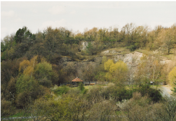
Bild 1: Gesamtansicht des Aufschlusses im Frühjahr 2004