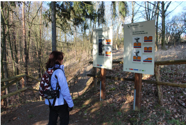
Bild 1: Infotafeln des Geoparkpfades Feuer und Wasser