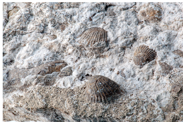
Bild 4: Daumennagelgroße Muscheln (Myophoria) gefunden im Gipsbruch und nun in der LfU-Sammlung