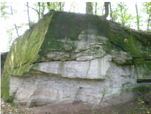
Bild 3: Abbauwand mit wulstigen Sediementstrukturen im oberen Teil