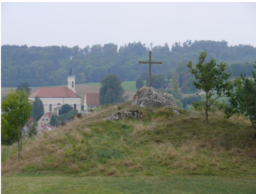
Bild 1: Allochthone, leicht vergrieste Weißjura-Scholle bei Zöschingen