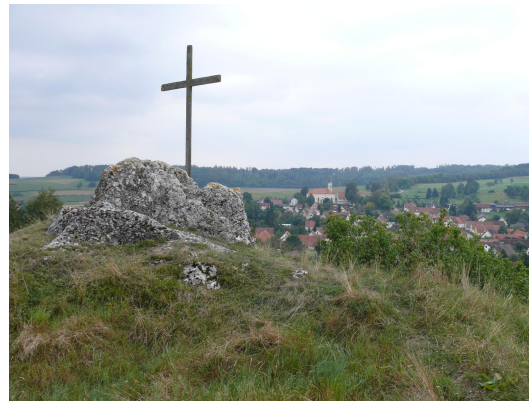
Bild 2: Allochthone, leicht vergrieste Weißjura-Scholle bei Zöschingen