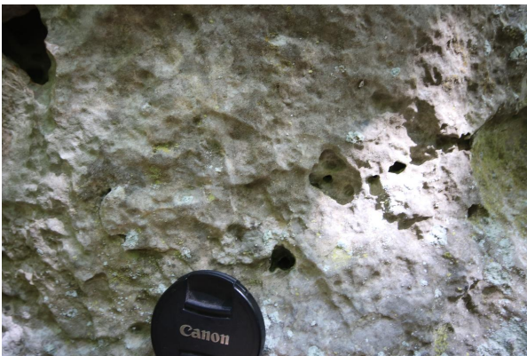
Bild 3: Wenig beanspruchter allochthoner Massenkalk aus dem Weißjura