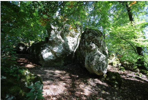
Bild 1: Osterstein nordöstlich von Unterfinningen mit allochthonen Blöcken aus Weißjura-Massenkalk