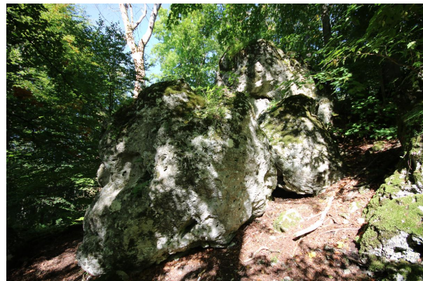
Bild 4: Osterstein nordöstlich von Unterfinningen mit allochthonen Blöcken aus Weißjura-Massenkalk