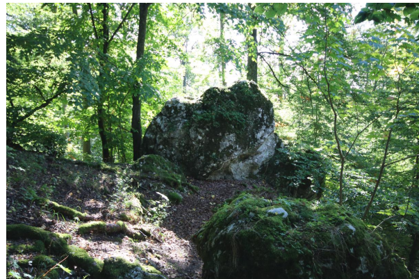
Bild 2: Osterstein nordöstlich von Unterfinningen war vorgeschichtliche Kultstätte