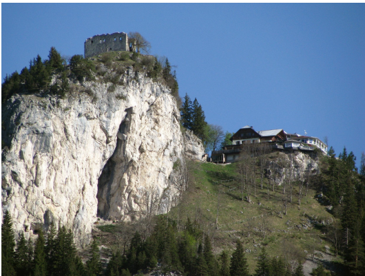
Bild 1: