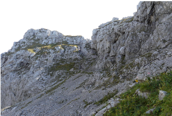
Bild 1: Krähe mit Krähenhöhle unter der überhängenden Wand in Bildmitte