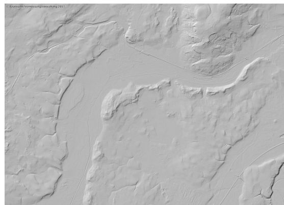
Bild 4: Digitales Geländemodell