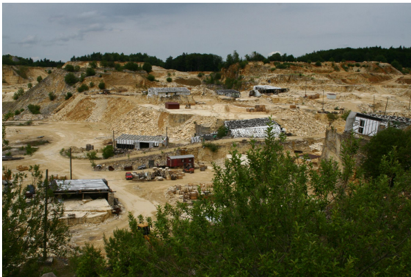
Bild 1: Der Steinbruch bei Solnhofen mit aktiven Bereichen und teilweiser Verfüllung und Bewuchs im Hintergrund