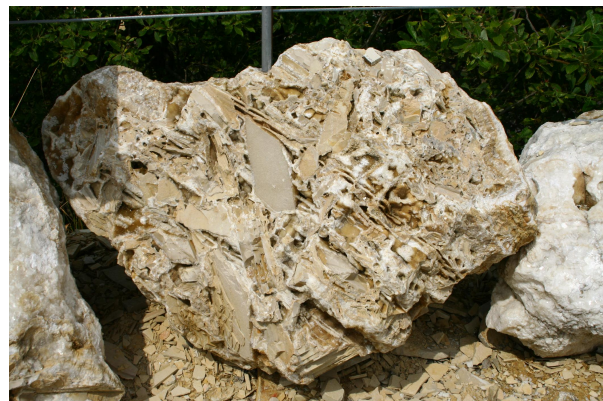
Bild 4: Ein Block auf Plattenkalk Bruchstücken und Kalzitausfällungen (weiße Bereiche)