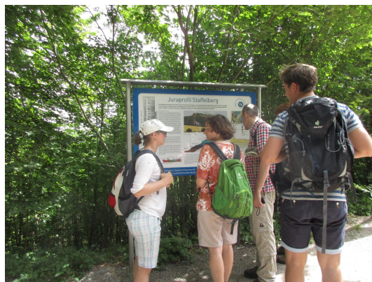
Bild 4: Die Infotafel am Staffelberg über Bayerns schönstes Geotop Nr. 74: Juraprofil Staffelberg